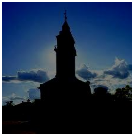
Biserica Reformată din Komádi