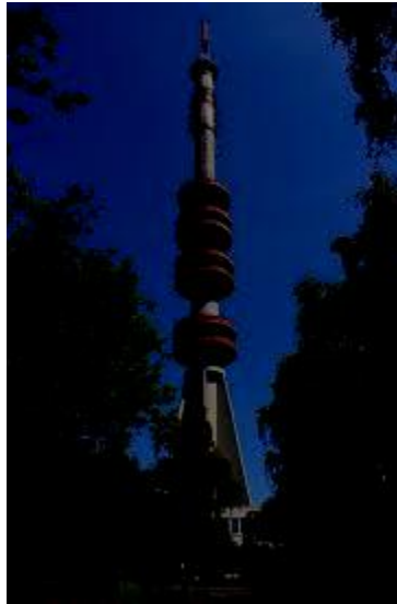
Turnul TV din Komádi